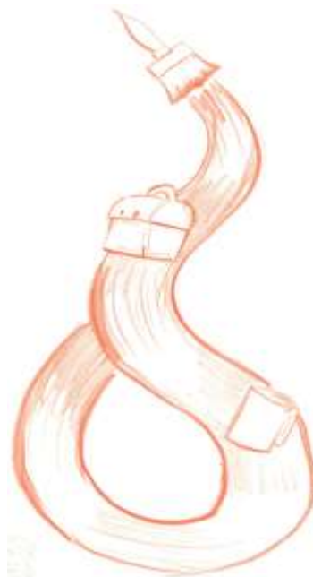
Illustration 2: Saras tegning. Fra refleksionscirkel, forår 2016.

Penslen er kunstneren, som den øverste, der sætter et flow i gang ned over børnene. Og så står vi nederst som pædagoger med kaffekoppen – og så går det tilbage igen, det er sådan et flow. ... Jeg synes, vi har stået lidt på sidelinjen som observator og facilitator, og det har jo sådan set kommet fra kunstneren ned til børnene, og så har vi hjulpet til. Og så har vi bagefter haft nogle smårefleksioner, og så er det kommet op til kunstneren igen.