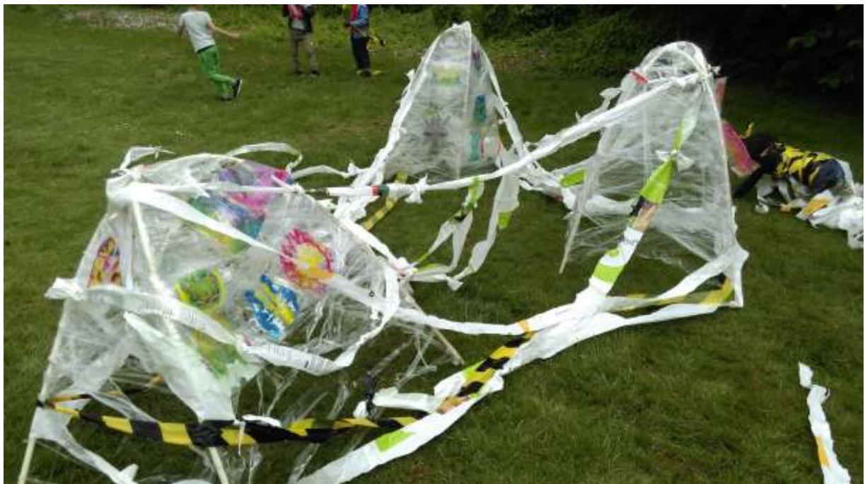
Illustration 7: Plastikhytter forbindes på "Store legedag", juni 2016.

Samskabelsesprocessen og det at være sammen som et "vi" viste sig også til den afsluttende "Store legedag", som udspillede sig på nærområdets offentlige græsplæne. Her medbragte alle medvirkende institutioner deres plastikhytter, og kunstneren igangsatte en legende proces, hvor børn og pædagoger forbandt hytterne med lange plastikbånd.